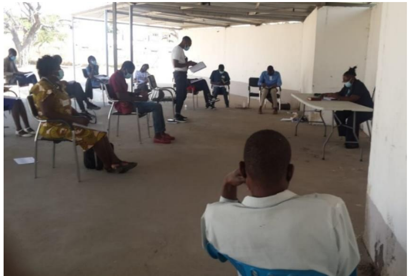
Gender Justice workshop Angolassa

Olemme olleet mukana näissä työpajoissa ja kokouksissa Suomesta käsin. Hieman oudolta on tuntunut pitää opetusta ja esitelmiä etänä maapallon toiselta puolelta, mutta palautteesta päätellen se on otettu kiitollisesti ja ymmärtäen vastaan. Kaikki hyväksyvät olosuhteet, tilanteeseen on vain mukauduttava.