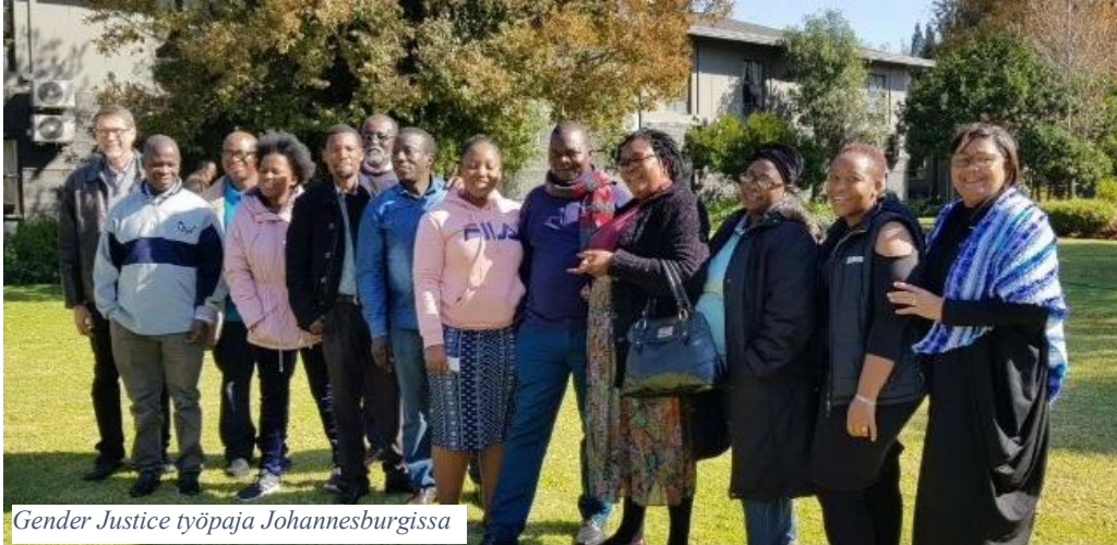
Gender Justice työpaja Johannesburgissa

Musiikin, liturgian ja jumalanpalveluselämän kehittämishankkeessa päästiin myös mukavasti vauhtiin. Woodpeckerin keskuksessa Botswanassa kokoontui lokakuun lopussa kolmen luterilaisen kirkon edustajia. Lusakassa Sambiasa 11.-14.11. taas kahden sikäläisen luterilaisen kirkon edustajia. Molemmissa kävimme läpi liturgian sisältöä, musiikin merkitystä ja lopulta jumalanpalveluksen kontekstualisoinnin mahdollisuuksia. Vastaanotto oli rohkaisevan innostunutta ja työskentelyä halutaan jatkaa.