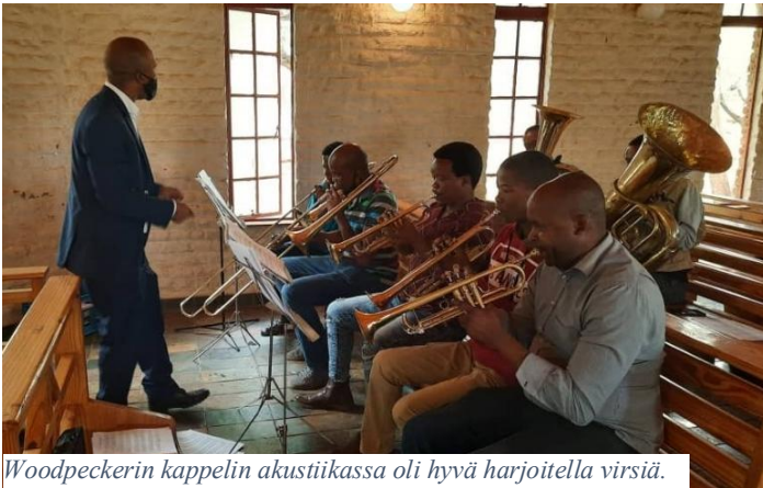
Woodpeckerin kappelin akustiikassa oli hyvä harjoitella virsiä.

Musiikin, liturgian ja jumalanpalveluselämän kehittämishankkeessa päästiin myös mukavasti vauhtiin. Woodpeckerin keskuksessa Botswanassa kokoontui lokakuun lopussa kolmen luterilaisen kirkon edustajia. Lusakassa Sambiasa 11.-14.11. taas kahden sikäläisen luterilaisen kirkon edustajia. Molemmissa kävimme läpi liturgian sisältöä, musiikin merkitystä ja lopulta jumalanpalveluksen kontekstualisoinnin mahdollisuuksia. Vastaanotto oli rohkaisevan innostunutta ja työskentelyä halutaan jatkaa.