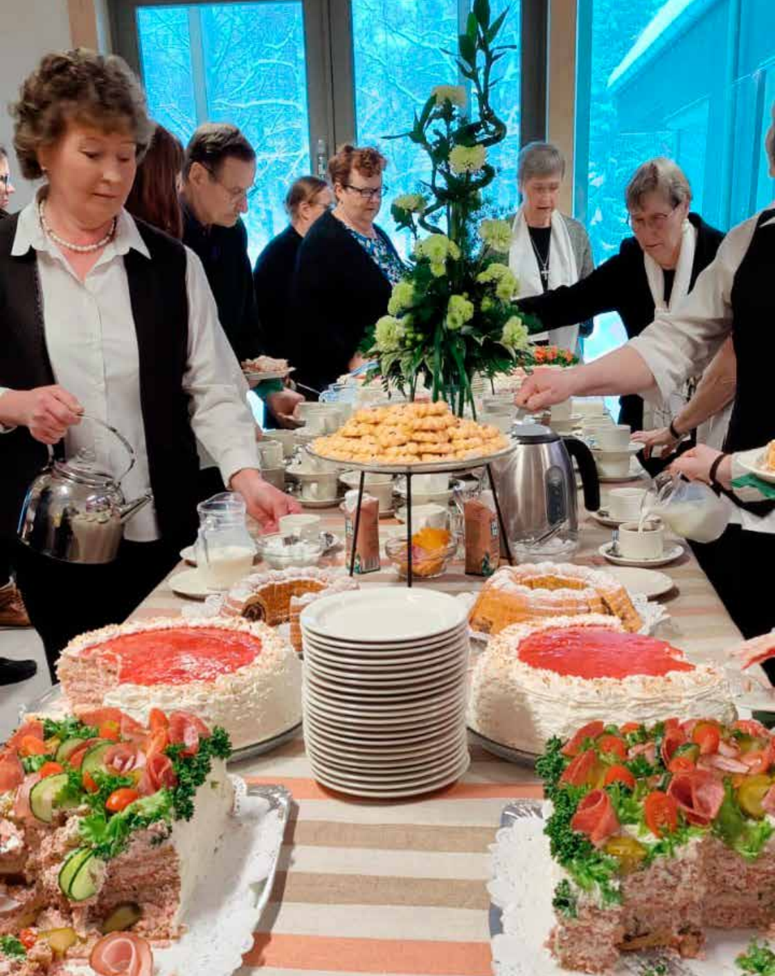
Juhlapöydän herkulliset tarjoilut maistuvat seurakuntalaisille.